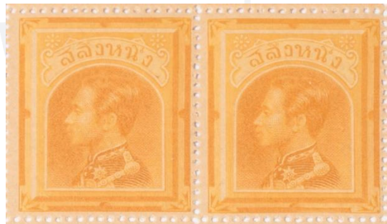
ดวงตราไปรษณียากร สมัยรัชกาลที่ ๕ ชนิดราคาสลึงหนึ่ง

๖.๒ แบบที่ ๒ สีน้ำตาลแกมส้ม (สีเหลืองปนส้ม) (Brown Orange)