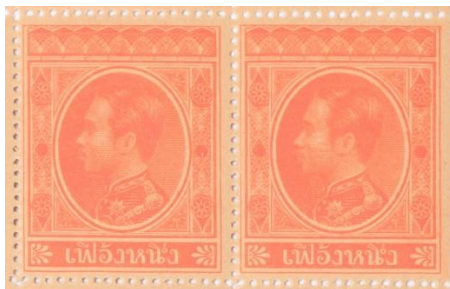
ดวงตราไปรษณียากร สมัยรัชกาลที่ ๕ ชนิดราคาเฟื้องหนึ่ง

๕. ดวงตราไปรษณียากร สมัยรัชกาลที่ ๕ ชนิดราคาเฟื้องหนึ่ง จำนวนพิมพ์ ๕๐๐,๐๐๐ ดวง ขนาดเต็มแผ่น กว้าง ๒๑ เซนติเมตร ยาว ๓๑.๕ เซนติเมตร ขนาดแต่ละดวง กว้าง ๒.๕ เซนติเมตร ยาว ๓.๐ เซนติเมตร มีสีแดงหรือแดงเข้ม (Red or Deep Vermilion)