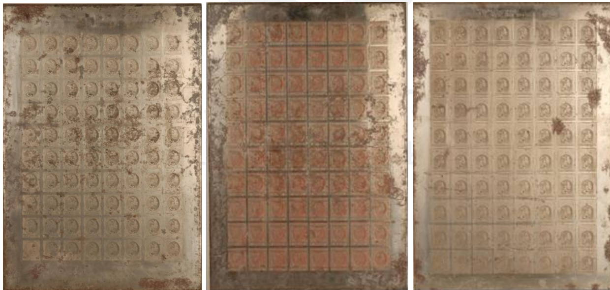
แม่พิมพ์ดวงตราไปรษณียากร สมัยรัชกาลที่ ๕ (ชุดโสฬศ)

ดวงตราไปรษณียากรชุดนี้มีระบบการพิมพ์เป็นแบบลายเส้นหรือเส้นนูน แผ่นหนึ่งมีแสดตมภ์ ๘๐ ดวง คือ แถวแนวนอน ๘ ดวง ทั้งหมด ๑๐ แถว (๘ ดวง x ๑๐ แถว) ใช้วิธีการแกะสลักภาพแบบตราไปรษณียากรลงบนแผ่นเหล็ก เรียกว่า ระบบแกะสลัก (Steel Engraving) หรือ Intaglio (อินทาลโย) หรือเรียกว่า แม่พิมพ์ร่องลึก เป็นการพิมพ์ภาพบนกระดาษให้สีอยู่ในร่องลึกของแม่พิมพ์โลหะ โดยทำให้เกิดความลึกด้วยเครื่องมือหลายชนิด ซึ่งแกะสลักลงบนเนื้อโลหะ ระบบการพิมพ์แบบลายเส้นหรือเส้นนูน เป็นการแกะสลักลายภาพแบบตราไปรษณียากรลงบนแผ่นเหล็ก และภาพย่อจากต้นแบบให้เล็กลงเหลือขนาดเท่ากับตราไปรษณียากรจริง โดยอาศัยช่างฝีมือที่มีความชำนาญในการแกะสลักลายเส้นเป็นอย่างดี ซึ่งยากมากเพราะมีขนาดเล็ก และต้องใช้แว่นขยายช่วยในการทำงาน ด้วยกรรมวิธีที่ยุ่งยากและซับซ้อน ใช้เวลานาน มีค่าใช้จ่ายสูง การพิมพ์ดวงตราไปรษณียากรในระบบนี้ส่วนใหญ่มักใช้กับการพิมพ์ดวงตราไปรษณียากรพระบรมฉายาลักษณ์ชนิดราคาสูงหรือกลาง และใช้กับตราไปรษณียากรพิเศษ เพื่อให้ยากแก่การปลอมแปลง ๔