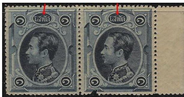
ดวงตราไปรษณียากร สมัยรัชกาลที่ ๕ ชนิดราคาหนึ่งโสฬศ

๑.๒ แม่พิมพ์ แบบที่ ๒ พื้นในวงรีแสดงราคา “โสฬศ” เป็นขีดแนวราบขนานกัน