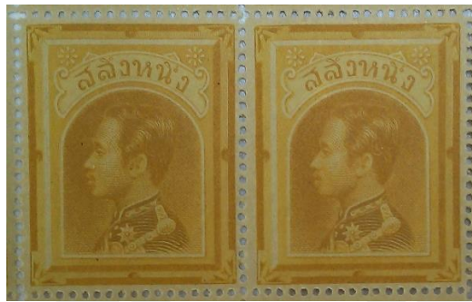
ดวงตราไปรษณียากร สมัยรัชกาลที่ ๕ ชนิดราคาสลึงหนึ่ง

๖.๑ แบบที่ ๑ สีน้ำตาลแกมเหลือง (สีอิฐ) (Brown Ochre)