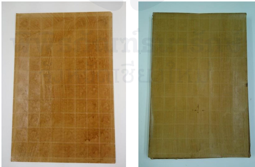
สภาพกาวที่อยู่บริเวณด้านหลังของดวงตราไปรษณียากร

กาวที่อยู่บริเวณด้านหลังของดวงตราไปรษณียากร สมัยรัชกาลที่ ๕ มีส่วนประกอบของไซโคลเด็กซ์ตริน (Cyclodextrin) เป็นกาวที่ผลิตจากแป้งมันฝรั่ง มีสีขาว เป็นกาวที่ละลายในน้ำ มีคุณสมบัติในการยึดติดกระดาษได้ดี แห้งเร็ว เมื่อแห้งแล้วจะมีความแข็ง นิยมนำมาใช้เป็นกาวบริเวณด้านหลังของดวงตราไปรษณียากร กระดาษกาวและซองจดหมาย เป็นต้น ๖