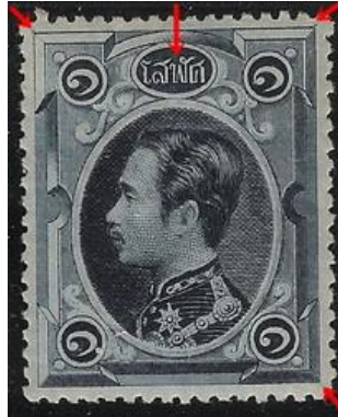
ดวงตราไปรษณียากร สมัยรัชกาลที่ ๕ ชนิดราคาหนึ่งโสฬศ

๑.๓ แม่พิมพ์ แบบที่ ๓ พื้นในวงรีแสดงราคา “โสฬศ” เป็นขีดแนวราบขนานกันคล้ายแบบที่ ๒ แต่มีจุดขนาดเล็กอยู่ที่บริเวณมุมนอกกรอบ ๓ มุม ยกเว้นมุมล่างขวาของดวงตราไปรษณียากรที่ไม่มีจุด