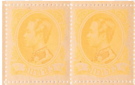
ดวงตราไปรษณียากร สมัยรัชกาลที่ ๕ ชนิดราคาซีกหนึ่ง

๔. ดวงตราไปรษณียากร สมัยรัชกาลที่ ๕ ชนิดราคาซีกหนึ่ง จำนวนพิมพ์ ๕๐๐,๐๐๐ ดวง ขนาดเต็มแผ่น กว้าง ๑๙.๕ เซนติเมตร ยาว ๒๙.๕ เซนติเมตร ขนาดแต่ละดวง กว้าง ๒.๒ เซนติเมตร ยาว ๒.๕ เซนติเมตร มีสีเหลืองอ่อน (Yellow) ถึงเหลืองเข้ม (Chrome Yellow)