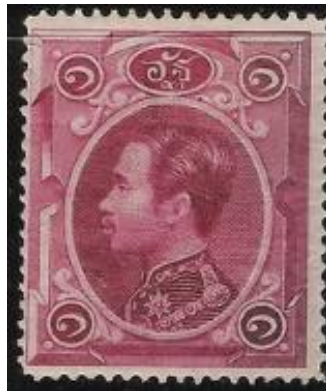
ดวงตราไปรษณียากร สมัยรัชกาลที่ ๕ ชนิดราคาหนึ่งอัฐ

๒. ดวงตราไปรษณียากร สมัยรัชกาลที่ ๕ ชนิดราคาหนึ่งอัฐ จำนวนพิมพ์ ๕๐๐,๐๐๐ ดวง ขนาดเต็มแผ่นกว้าง ๒๒ เซนติเมตร ยาว ๒๗ เซนติเมตร ขนาดแต่ละดวง กว้าง ๒.๓ เซนติเมตร ยาว ๒.๘ เซนติเมตร ๒ มีสีชมพูอ่อน (Pale Rose Carmine) ถึงสีแดงเข้ม (Deep Rose Carmine)