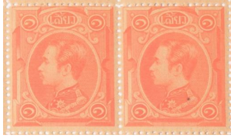
ดวงตราไปรษณียากร สมัยรัชกาลที่ ๕ ชนิดราคาหนึ่งเสี้ยว

๓. ดวงตราไปรษณียากร สมัยรัชกาลที่ ๕ ชนิดราคาหนึ่งเสี้ยว จำนวนพิมพ์ ๕๐๐,๐๐๐ ดวง ขนาดเต็มแผ่น กว้าง ๒๒ เซนติเมตร ยาว ๒๗ เซนติเมตร ขนาดแต่ละดวง กว้าง ๒.๓ เซนติเมตร ยาว ๒.๘ เซนติเมตร มีสีแสด (Vermilion)